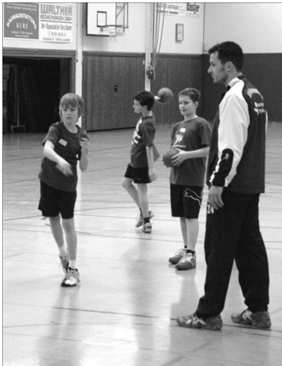
Beim richtigen Wurf aufs Tor soll der Oberkörper mit gedreht werden.